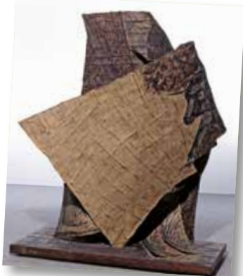
Odile MIRI, Dédale, 1987, Collection les Abattoirs, Musée - Frac Occitanie Toulouse, © droits réservés, photo : Studio Marco Polo