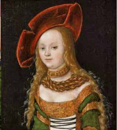
Fondation Bernberg, Toulouse - © RMN-Grand Palais - Mathieu Rabreau