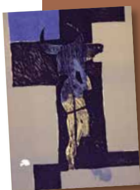
Patrick LOSTE, Minotaure, s.d., Collection les Abattoirs, Musée - Frac Occitanie Toulouse, © droits réservés, photo : Grand Rond Production